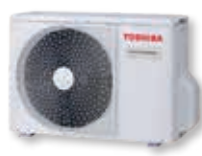
RAV-GM301ATP-E RAV-GM401ATP-E RAV-GM561ATP-E